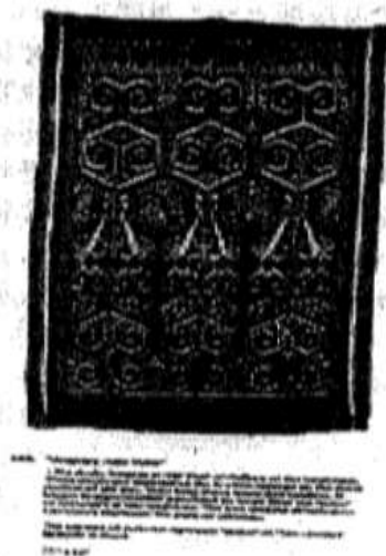
图 (三十一) 人头线毯被 (Pua Antu pala)