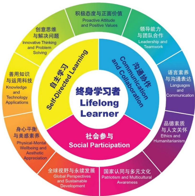
《课程总纲》核心素养结构图