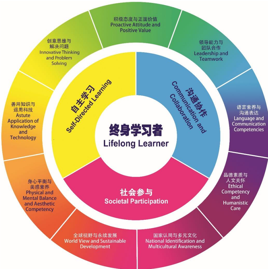
图 1：核心素养结构图

《总纲》依据《独中教育蓝图》提出的六项核心素养 2 ，及因应课程发展需要增加的三项核心素养，组成九项核心素养。在规划初高中课程发展阶段时进一步说明其内涵。核心素养强调人的综合素质，也涵盖了知识、能力以及态度。