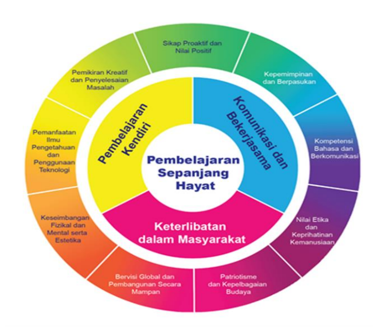
Rajah 1: Kerangka Kompetensi Teras

Garis Panduan digubal berasaskan sembilan kompetensi teras, iaitu enam kompetensi teras yang disarankan dalam Pelan Induk Pendidikan SMPC 2 dan ditambahkan lagi tiga kompetensi untuk tujuan pembangunan kurikulum. Kompetensi ini menitikberatkan pembangunan modal insan, ilmu pengetahuan, nilai dan sikap. Kandungan kompetensi teras ini dihuraikan di bahagian rancangan kurikulum TMT dan TMR.